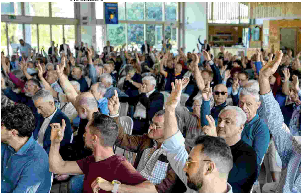
Un momento del voto per i soci di Banca Centro Emilia durante l'assemblea a Casumaro

Solidità patrimoniale e qualità del credito frutto del lavoro quotidiano (Govoni)