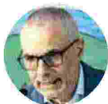
Giovanni Govoni direttore generale BCE

Il bilancio conferma la forza di un modello cooperativo