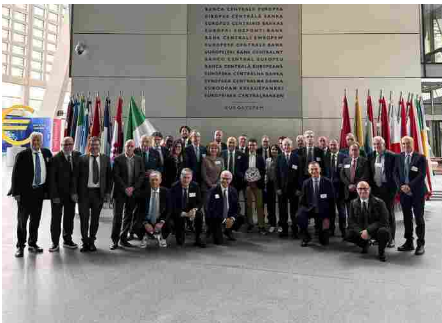
Federazione BCC ER Banca Centrale Europea