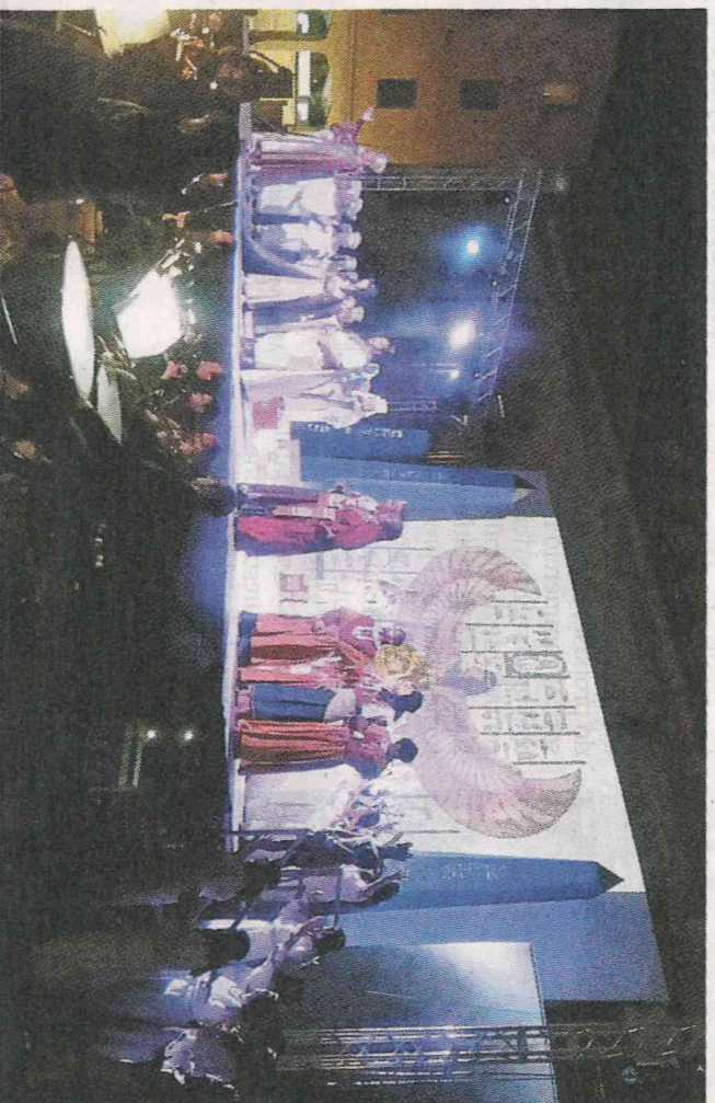
Una scena dell'Aida di Verdi rappresentata in piazza Guercino durante lo scorso mese di giugno

QUESTIONE PERSONALE Da risolvere c'è la questione del personale dipendente: