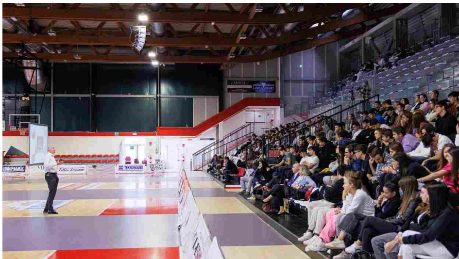
Educazione finanziaria tra i banchi di scuola

L'incontro con gli studenti del Bassi-Burgatti, del Cevolani e del 'Fratelli Taddia' rientra in un progetto ministeriale.