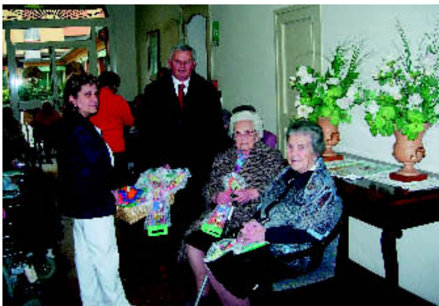
Un momento della visita alla casa di riposo "Cavalieri"

La Banca, con questa piccola iniziativa, come in tante altre occasioni, si propone di perseguire il fine sociale e di mutualità, sostenendo e migliorando le condizioni morali di coloro che appartengono alla comunità in cui opera.