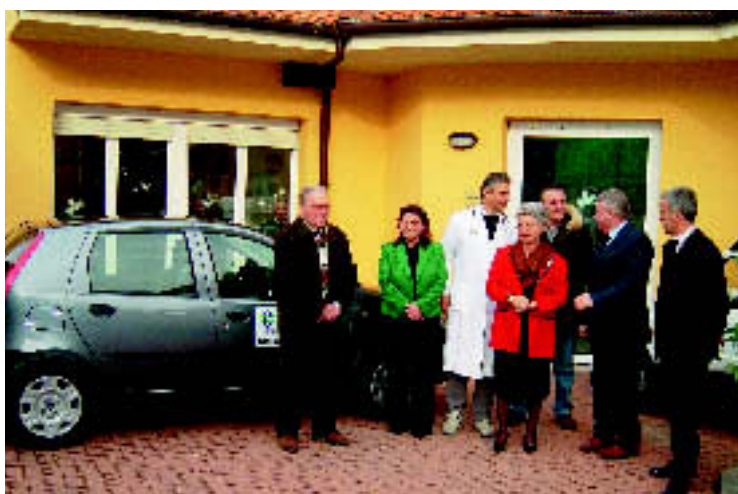
Il momento della consegna dell'auto

L'obiettivo per i prossimi anni è di perseverare in questa attività di sostegno con un piano di sponsorizzazioni che consenta agli enti beneficiari l'aiuto necessario per il perseguimento dei loro obiettivi statutari, con vantaggio palese per l'intero territorio in cui operano, ma anche più specificamente, per i soggetti legati alla Banca, in termini di agevolazioni alla partecipazione delle loro iniziative