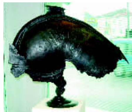
Opere di Quinto Ghermandi